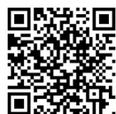
UX10 3D Demo